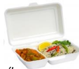
Cena obedného menu pre rozvoz: 5,50 €

Zmena polievky z jedálneho lístka podľa aktuálneho cenníka